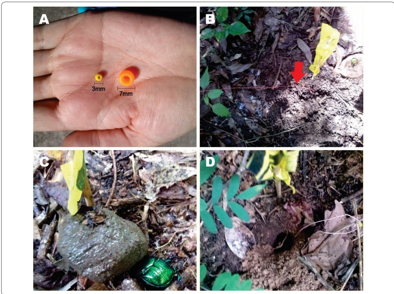
Figura 1. Detalles del experimento realizado para cuantificar la remoción de las heces y la dispersión de semillas. A. Cuentas plásticas chicas y grandes colocadas dentro de bolitas de heces a manera de semillas artificiales; B. Cuenta marcada con un hilo para facilitar su seguimiento. C. Escarabajos del estiércol atraídos a las porciones de heces frescas de 10 g; D. Túnel construido para enterrar las heces y cuentas.

conteniendo una cuenta de plástico a manera de semilla artificial. El uso de cuentas de plástico ha demostrado ser un método efectivo para cuantificar la dispersión secundaria de semillas por escarabajos coprófagos (Andresen, 2002a). No existe una preferencia de remoción entre semillas artificiales y semillas reales (Koike et al. , 2012); además, las cuentas de plástico tienen la ventaja de no ser removidas por los roedores (Andresen, 2002a). Se sabe que las semillas más pequeñas tienen mayor probabilidad de ser dispersadas por los Scarabaeinae que las de mayor tamaño (Andresen & Feer, 2005), por lo que se trabajó con cuentas de dos tamaños (Fig. 1A): chicas (3 mm de diámetro y 0.08 g de peso) y grandes (7 mm de diámetro y 0.3 g de peso). Para poder registrar el movimiento de las cuentas, a cada una se le ató un hilo resistente (tipo zapatero) de 50 cm de largo. El otro extremo del hilo se dejó libre (Fig. 1B).