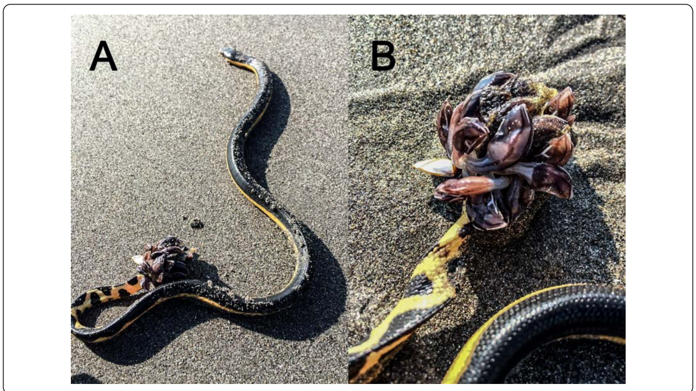
Figura 2. A) Especimen de H. platurus con epibiontes de la especie Conchoderma virgatum . B) Vista cercana de C. virgatum .

Este reporte es un registro interesante por la ubicación en tierra del ejemplar, ya que otros han sido observados en ambientes marinos neríticos y pelágicos. Asimismo, esta es la primera vez que en las costas de Chiapas se les encuentra a C. virgatum y H. platurus asociados, así como el registro más austral de éstos en el Pacífico mexicano. Con cierta reserva, es probable que se trate del segundo reporte en México de esta interacción, después de la publicación de Alvarez & Celis (2004) en la costa del estado de Jalisco (porción del Pacífico Central del país). Geográficamente, existe una distancia en línea recta de aproximadamente 1, 200 km entre el registro de los autores citados y la de este trabajo. En términos de tiempo, hay un período de 20 años entre ambos hallazgos. La serpiente marina de Alvarez & Celis (2004) tenía una longitud similar a la aquí descrita (61.97 cm vs 61 cm), y la longitud de los percebes de su artículo es casi idéntica (1.12 cm vs 1.2 cm), pero hay una