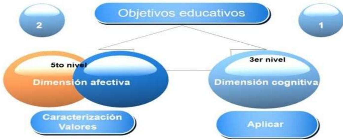
Fig. 2 - Problemas identificados en la caracterización del desempeño docente en la formación académica de posgrado por dimensiones