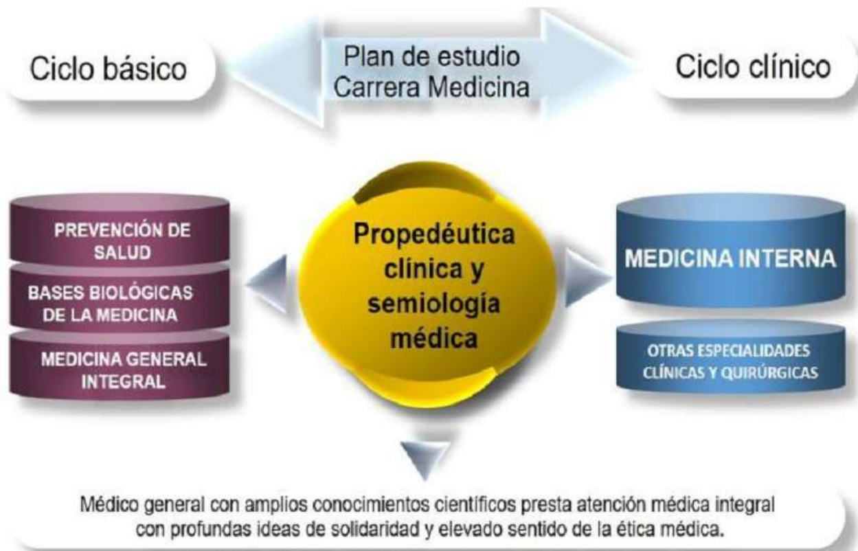
Fig. 1 - Interrelación de la asignatura “Propedéutica Clínica y Semiología Médica” con el resto del currículo del plan de estudio de la carrera de Medicina.

En la Figura 1 se muestra la interrelación del programa de la asignatura Propedéutica clínica con el resto del currículo.