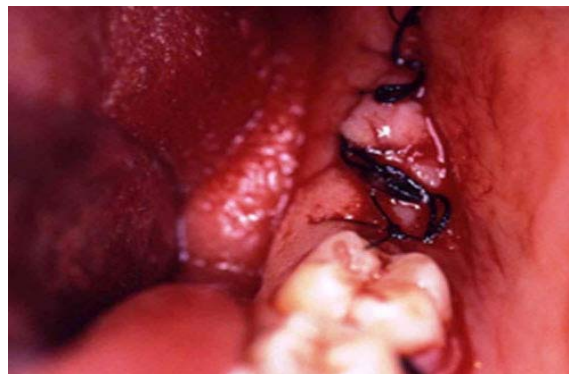
Figura 4. Tratamiento quirúrgico concluido.