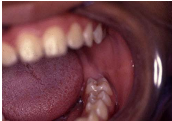
Figura 5. Primer molar permanente brotado (36).

A los 6 meses de evolución se observó el brote normal del molar permanente (36) sin alteraciones (Figura 5).