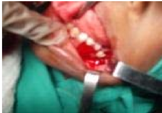
Figura 3. Se observa 36 sin alteraciones.

El tratamiento médico recibido en el hogar contó con el uso de amoxicilina, dipirona, termoterapia, y colutorios antisépticos, con una evolución satisfactoria, en seguimiento hasta los 5 años de operado.