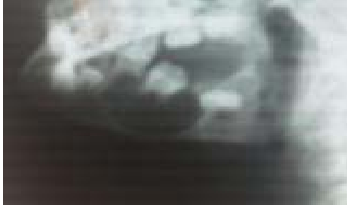
Figura 1. Imagen unilocular radiolúcida en relación con 36.

Vista lateral oblicua izquierda de mandíbula (Figura 1): Imagen unilocular radiolúcida desde 74 hasta espacio retromolar.