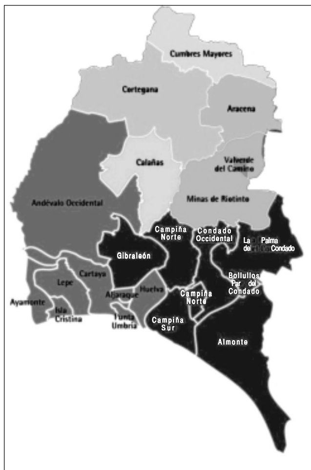
Figura 1. Representación gráfica de zonas en la provincia de Huelva con TSH neonatal > 5 \text{ mUI/L} . 11 En gris claro, concretamente en el distrito sanitario Sierra de Huelva-Andévalo, fue donde se centró este estudio.

Este estudio se llevó a cabo conjuntamente por la Unidad de Hipotiroidismo Congénito del Departamento de Bioquímica Clínica del Hospital Universi-