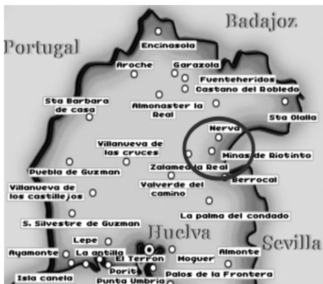
Figura 3. Localización de pueblos con niveles de yodo < 100 µg/L.

alguna relación entre bajos niveles de yoduria y distribución geográfica, y posibles causas. Los pueblos que tienen mayor número de gestantes con yodurias < 150 µg/L son Aracena, Calañas, Galaroza, Jabugo y Nerva ( p < 0.06 ) (Figura 3).