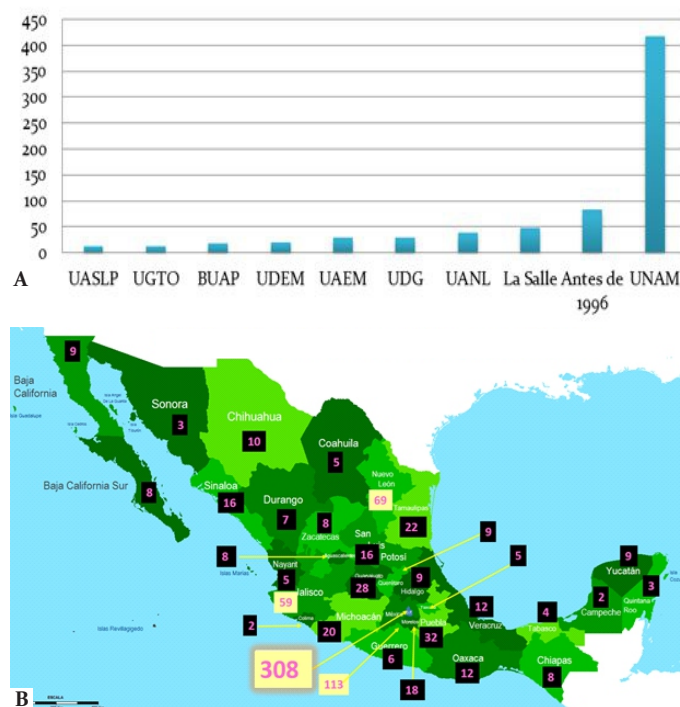
Figura 2. A) Distribución de neonatólogas respecto a la escuela de procedencia. B) Distribución de neonatólogas en México.

El liderazgo que muestran estas mujeres se traduce en acciones de más calidad, de mejor contenido y que resuelven la mayor parte de los problemas que afectan a los recién nacidos. Este es el primer reporte desde el punto de vista socio-demográfico de las Neonatólogas en México y con posterioridad se dará a conocer la contribución de estas mujeres a la actividad académica y científica de nuestro país.