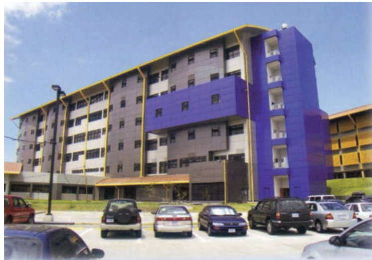
Abril 2010. Hospital San Vicente de Paúl