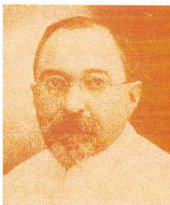
DR. EMILIO ECHEVERRÍA AGUILAR

EFECTUÓ SUS ESTUDIOS SUPERIORES EN EL COLEGIO DE MEDICINA DE NUEVA YORK EN ESTADOS UNIDOS, DONDE SE GRADUÓ COMO MÉDICO Y CIRUJANO EN EL AÑO 1890. LUEGO SE ESPECIALIZÓ EN ENFERMEDADES TROPICALES Y DE LA PIEL CONSTITUYENDOSE EN EL PRIMER DERMATOLOGO DEL PAIS. EN EL HOSPITAL DIRIGIÓ UN SALÓN DE MEDICINA GENERAL Y EL INSTITUTO NACIONAL DE HIGIENE, ESTE ÚLTIMO FUE UN ÓRGANO SANITARIO DEL ESTADO Y ADSCRITO AL HOSPITAL SAN JUAN DE DIOS. TAMBIÉN FUNGIÓ EN CALIDAD DE DIPUTADO, PRESIDENTE DE LA FACULTAD DE MEDICINA Y DIRECTOR DEL HOSPITAL DE LIMÓN; ADEMÁS, PUBLICÓ DIVERSOS TRABAJOS CIENTÍFICOS Y FORMÓ PARTE DEL CUERPO DIRECTOR DE LA REVISTA "GACETA MÉDICA" INICIADA EN 1896. FUE UN ANALISTA EJEMPLAR.