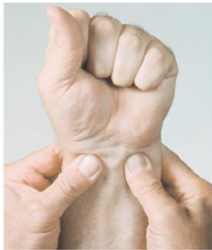
Figura 3. Obstrucción del flujo a nivel distal con formación extensa de arterias colaterales (A). Test de Allen (B).

Eritematoso Sistémico, Vasculitis Reumatoidea, Enfermedades mixtas del tejido conectivo y