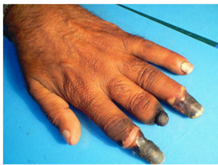
Figura 2. Gangrena digital distal.

distalmente en las arterias y venas de pequeño calibre de manos, pies, piernas y brazos, posteriormente progresarán afectando territorios más proximales, siendo el síntoma isquémico más frecuente la claudicación intermitente, la cual, en algunos casos puede llegar a confundir el diagnóstico con algún trastorno ortopédico, posteriormente aparecerán síntomas más severos como el dolor de reposo hasta la aparición de las úlceras isquémicas que, hasta en aproximadamente un 70% de los casos puede ser la manifestación inicial, y terminando finalmente en gangrena usualmente a nivel digital (Figura 2). La afectación de otros territorios vasculares, aunque infrecuente, puede significar una morbimortalidad importante para el paciente, por ejemplo, en el caso de aquellos que tengan afectación intestinal van a presentarse comúnmente con dolor abdominal isquémico,