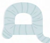
Figura 3. Sistema de apoyo JD.