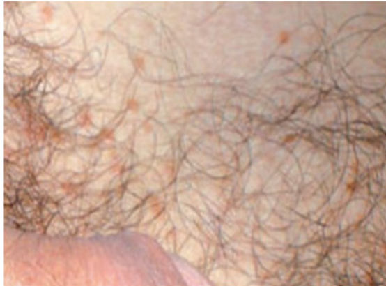
Fig. 1. Lesiones amarillentas en región abdominal.

escroto y cuerpo del pene presentaba pequeñas lesiones eritemato-violáceas, papuloides, de superficie verrugosa, compatibles con angioqueratomas (figuras 1,2,3). Se constató disminución en la intensidad de ambos ruidos cardiacos, taquicardia (118 lat/min), ritmo de galope, hipotensión (100/70 mmHg), pulso rápido y débil, piel fría, palidez cutáneomucosa y disnea.