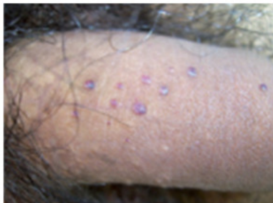
Fig. 3. Angioqueratomas, región genital.