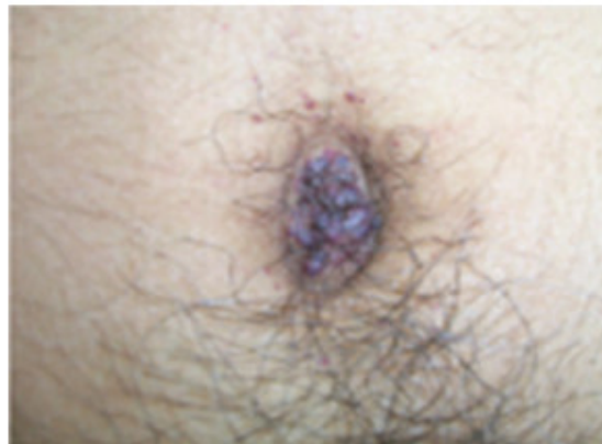
Fig. 2. Angioqueratomas, roseta peri-umbilical.