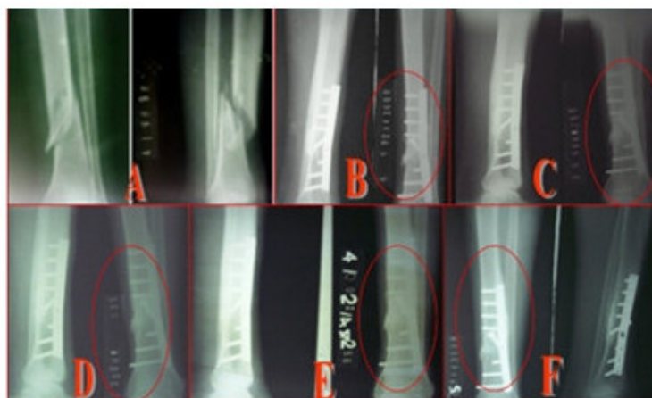
Fig. 1. Radiografías de fractura de tibia oblicua cerrada.

En la figura 1 se presenta un paciente al cual se le realizó una osteosíntesis interna, de 22 años de edad, en el momento en que fue operado, hace 10 años: (A) de una fractura del tercio distal de tibia cerrada, tipo B3.2. (B) Mostrando el caso operado a los 4 meses donde se aprecia el granulado de HAP-200. (C) Al año de operado aún se observa el granulado. (D) A los dos años se observa con menos densidad. (E) Cuatro años después se encuentra más osteointegrado. (F) Al cabo de los 10 años no se observa prácticamente el biomaterial.