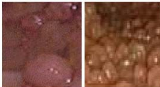
Fig. 2. Pólipos múltiples de colon.