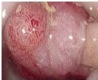
Fig.1. Pólipo erosionado de colon.

Videocolonoscopia: Pólipos múltiples en toda la extensión del colon. Se puede observar en las figura 1 y 2 , la presencia de pólipos con erosión de su superficie.