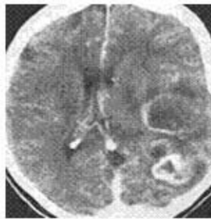
Fig. 4. TAC de Cráneo Contrastada.

Estudios histopatológicos: Biopsia de pólipos en estómago y colon, informan adenomas.