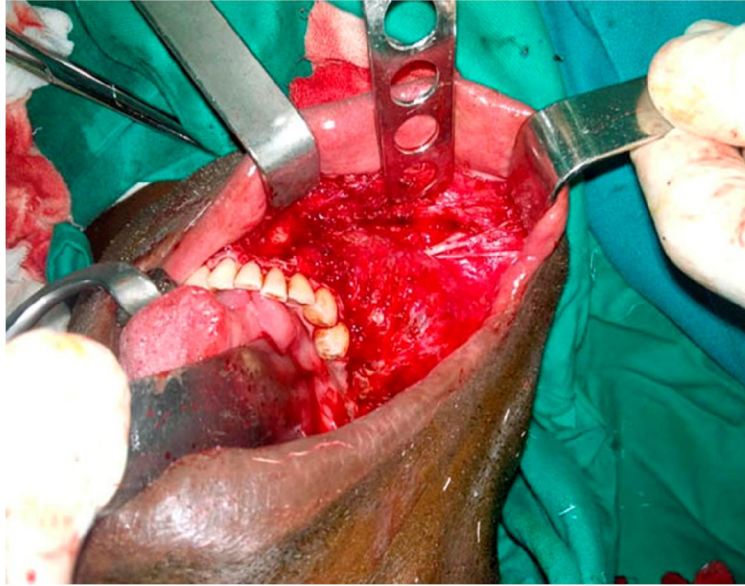
Fig. 2. Nótese el nervio mentoniano emergiendo del ameloblastoma.

Una vez expuesto el tumor, se procedió a realizar osteotomía con fresas quirúrgicas a nivel del diente 41 y de la rama mandibular derecha, con amplios márgenes de seguridad. ( Fig. 3. )