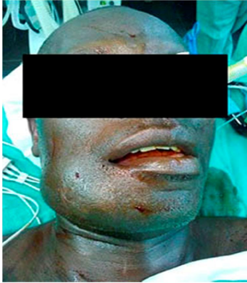
Fig. 1. Ameloblastoma multiquístico derecho.

El paciente refirió, además, parestesia, dificultad para la deglución y el habla, y pérdida de la función masticatoria. No hubo masa en el cuello ni linfadenopatías palpables. Al examen radiográfico se pudo observar una imagen radiolúcida multinucleada, que se extendía desde la región del diente 43 hasta la rama mandibular derecha, sin afectar el cóndilo.