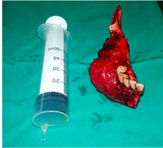
Fig. 4. Ameloblastoma multiquístico derecho extraído con márgenes de seguridad.

El examen histopatológico de la pieza removida, reveló fragmentos de neoplasia benigna de origen odontogénico, caracterizada por la proliferación de células epiteliales agrupadas en cordones anastomosados y células basales con núcleo hipercolorado y base polaroide invertida, confirmando el diagnóstico de ameloblastoma multiquístico. Los márgenes de resección anterior, posterior, medial y lateral, se hallaron libres de lesión, y el tamaño tumoral en sentido postero-anterior fue de aproximadamente 8 cm. (Fig. 4.)