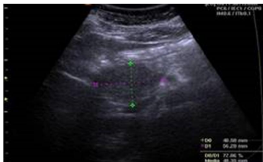
Fig. 1. Ecografía abdominal.

Ecografía: proceso ocupativo, hipoeoico, heterogéneo, aspecto tumoral de 5,5 x 4 cm de diámetro en proyección de cabeza pancreática ( Fig. 1 ); con técnica de Doppler escasa vascularización, que se encuentra en íntima relación con arteria hepática y vena porta, ubicándose entre ambas.