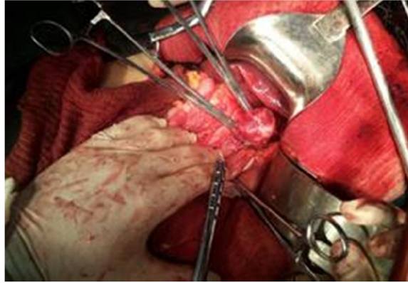
Fig. 3. Visión quirúrgica del tumor.