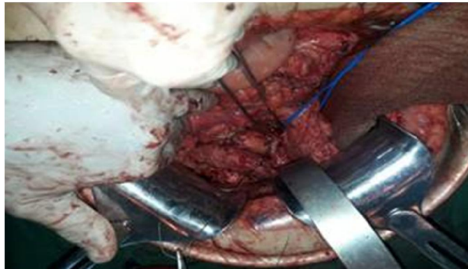
Fig. 5. Pancreatectomía cefálica con conservación del duodeno.