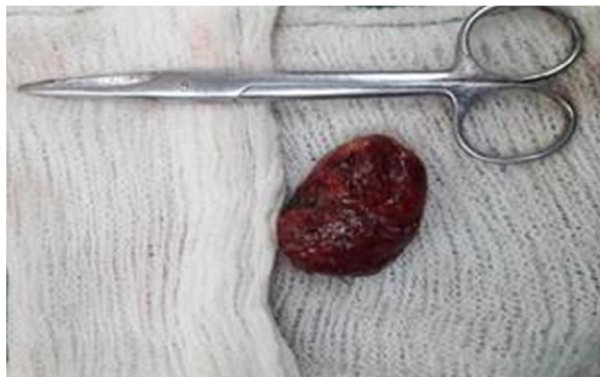
Fig. 4. Pieza quirúrgica.