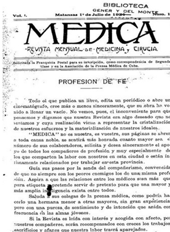
Fig. 1. Portada del primer número de la revista Médica .

Como señalara el Dr. Mario Dihigo en "Profesión de fe", la nota editorial del primer número —que ha servido de guía en todas las etapas: " Médica no es nuestra, es vuestra, sus páginas se abren a toda causa noble, se sentirá más honrada cuanto mayor sea el número de sus colaboradores". (1) En el mismo texto expone el objetivo de la revista, y la certeza de que su aparición contribuiría a estrechar las relaciones humanas y profesionales entre el gremio médico: