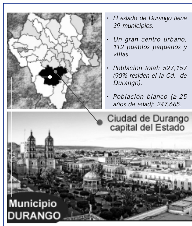
Figura 1. Proyecto BASID, población seleccionada: municipio de Durango.