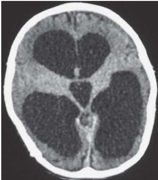
Figura 4. Tomografía de cráneo simple con dilatación del sistema ventricular con migración transependimaria. Pequeño hematoma subdural crónico frontal izquierdo.

meropenem y vancomicina. Egresó a los 40 días del internamiento sin HSP ni crisis epilépticas, con baclofeno a 2.5 mg/kg y carbamazepina. En la Resonancia Magnética se apreció dilatación del sistema ventricular bilateral y simétrico, tallo cerebral normal (Figura 5). Dos años después del evento el paciente presentó tetraplejía espástica, sin crisis convulsivas y continúa con baclofeno para control farmacológico de la espasticidad.