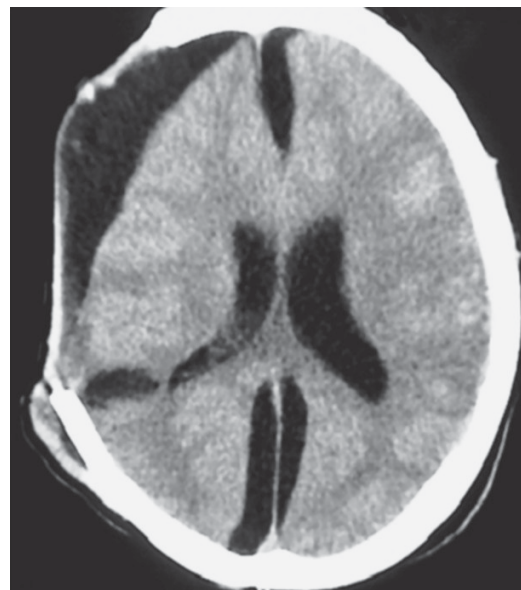
Figura 3. Tomografía de cráneo simple con higroma frontoparietal derecha y hoz cerebral izquierda, dilatación del sistema ventricular.