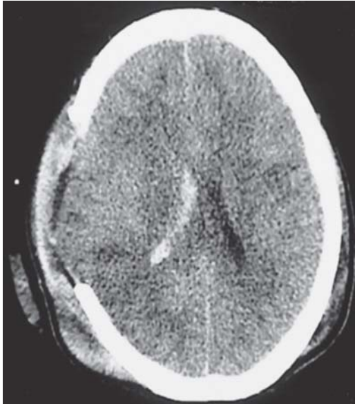
Figura 2. Tomografía de cráneo simple posterior a hemicraniectomía descompresiva, hemorragia intraventricular derecha, edema moderado a severo, imagen hipodensa en región parietal derecha por probables cambios isquémicos.

nuto, hipertensión arterial de 160-170/95-100, diaforesis, hipertermia de 39.5-40 °C, midriasis y aumento del tono generalizado con dos a tres horas de duración. Durante uno de los eventos se realizó EEG sin que evidenciara actividad paroxística, sólo se observó asimetría interhemisférica, con actividad lenta de alto voltaje sobre regiones frontocentrales derechas. Se continuó con carbamazepina, se descartó proceso infeccioso y se agregó propanolol a 1 mg/kg/día por sospecha de HSP. A las 48 horas de iniciado el beta bloqueador disminuyeron los eventos en número y duración. Egresó a los 35 días con eventos aislados de HSP de duración menor a 10 minutos. A los cuatro meses del traumatismo se encontró sin eventos disautonómicos y se colocó válvula de derivación ventrículo peritoneal (VDVP) por hidrocefalia secundaria a la hemorragia intraventricular (Figura 3).