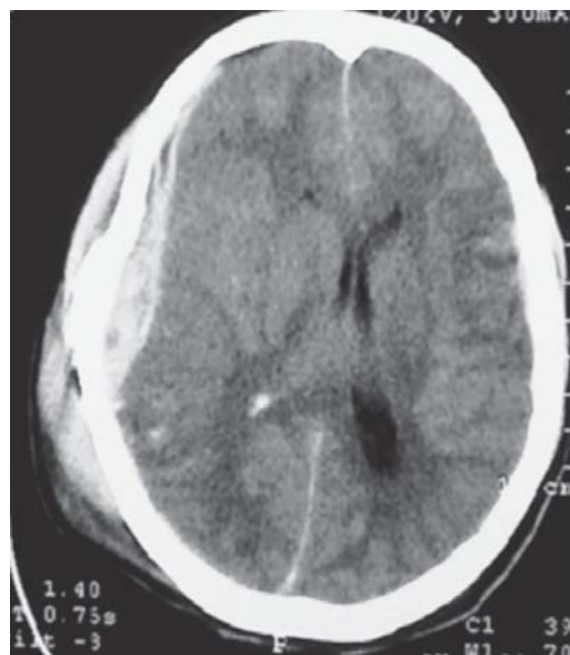
Figura 1. Tomografía de cráneo simple, con hematoma epidural y subdural derecho, que desplaza la línea media, edema cerebral moderado y hemorragia intraventricular derecha.

Adolescente de 14 años previamente sano que ingresó a nuestra institución posterior a sufrir atropellamiento. En sala de urgencias, la exploración física mostró hipertensión arterial, bradicardia, escala de Glasgow (GCS) 8/15, midriasis derecha, otorragia derecha con salida de material encefálico. Requirió intubación endotraqueal, sedación con midazolam y fentanilo, y se administró manitol en dosis única sin revertir la anisocoria. La tomografía de cráneo (TC) mostró un hematoma epidural temporoparietal derecho, hemorragia parenquimatosa parietal derecha, neumocráneo frontal, fractura conminuta temporal derecha y de piso medio derecho y hemorragia intraventricular (Figura 1). Se realizó drenaje del hematoma epidural y craniectomía por lesión en la duramadre con protrusión de masa encefálica. Posterior al procedimiento quirúrgico pasó a la Unidad de Terapia Intensiva Pediátrica (UTIP) con pupilas anisocóricas, reflejo fotomotor lento bilateral, bajo ventilación mecánica asistida, tratado con norepinefrina, fenitoína, vancomicina y meropenem, sedación con fentanilo y tiopental. A las 24 horas en