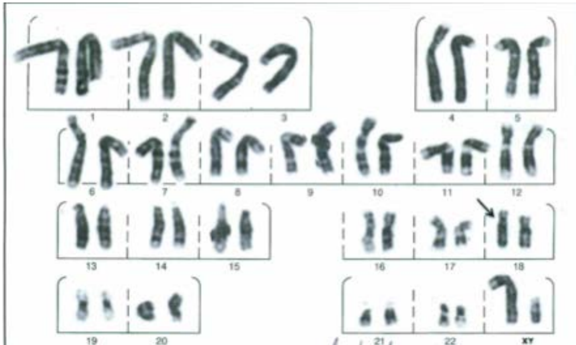
Figura 3. Estudio cromosómico.