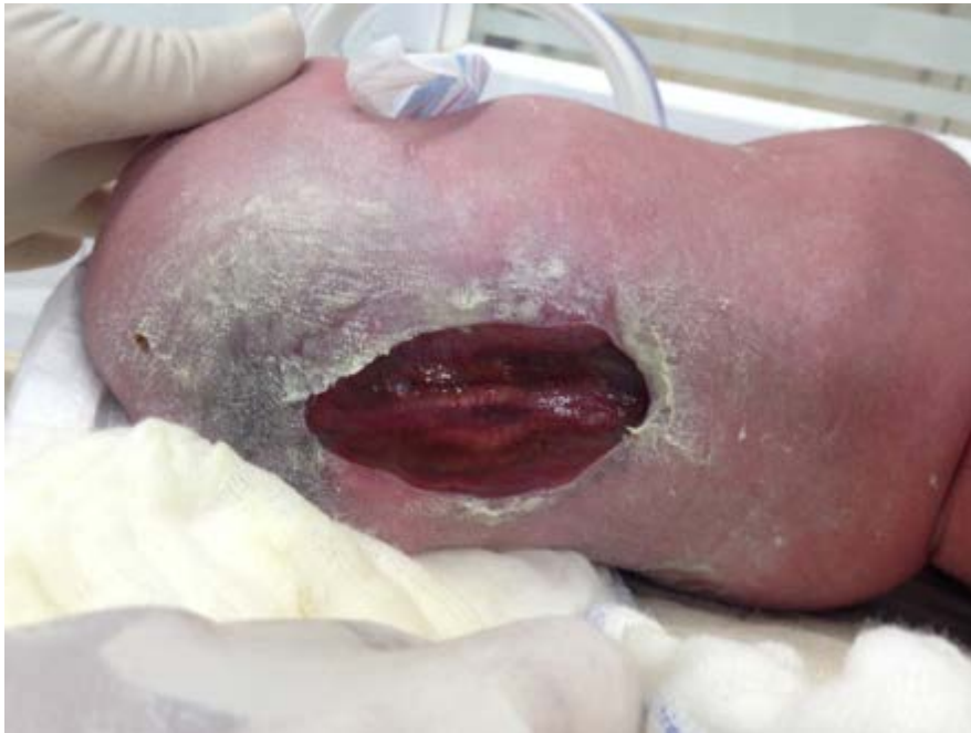
Figura 1. Lesión dorsolumbar extensa, sin fístula de líquido cefalorraquídeo.