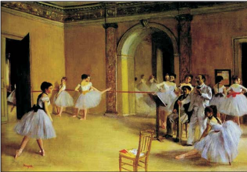
Fig. 6. Ensayo de Ballet. 1874. Óleo sobre lienzo, Musée d'Orsay, París, Francia.

mayoría tiene una presentación atrófica o seca; este último fue el tipo de lesión que presentó el maestro Edgar Degas, ya que su degeneración se caracterizó por ser lentamente progresiva, presentando manifestaciones después de los 50 años de edad, como cambios en su caligrafía (es evidente en la correspondencia del pintor el cambio a una letra alargada e irregular muy probablemente relacionado con la metamorfopsia). Esta es una manifestación temprana de dicha patología, que se caracteriza por una alteración en las formas.