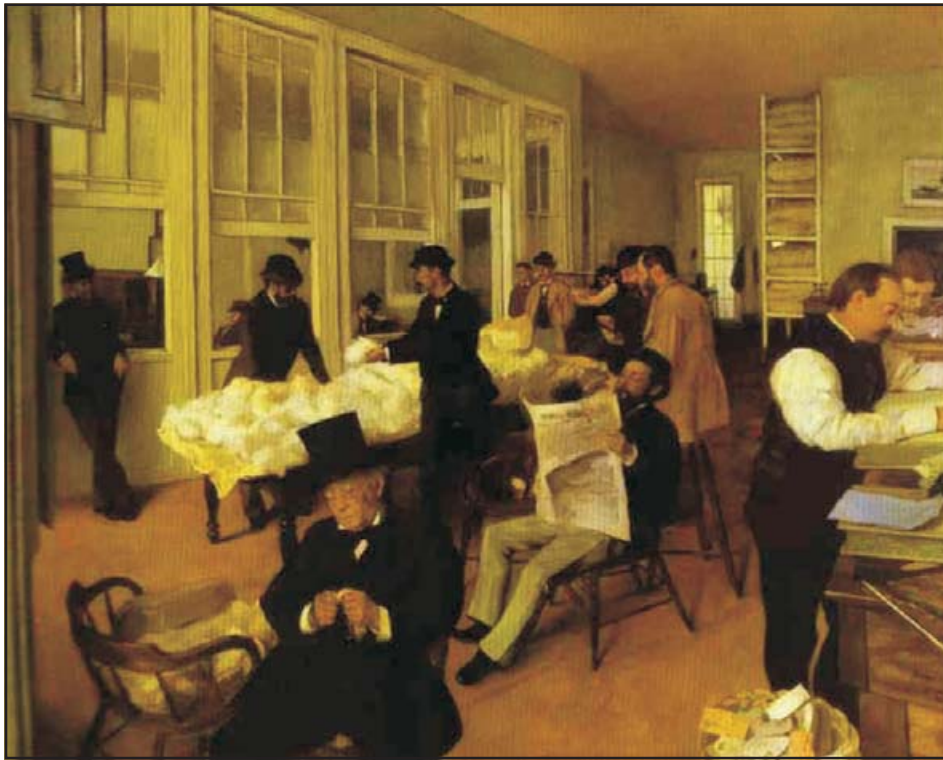
Fig. 3. Retratos de la oficina de algodón de Nueva Orleans. 1873. Óleo sobre lienzo. Musée des Beaux-Arts, Pau, USA.