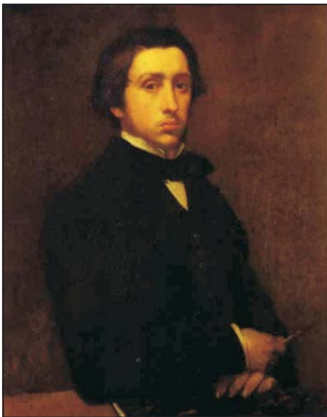
Fig. 1. Autorretrato 1855. Óleo sobre tela. Musée d'Orsay, París, Francia.

nistas y enamorado de las artes, aunque negado a educar artísticamente a su hijo. Junto a su padre, Edgar visitó varias veces el Louvre, y estas visitas fueron las que lo impulsaron a enamorarse de la pintura.