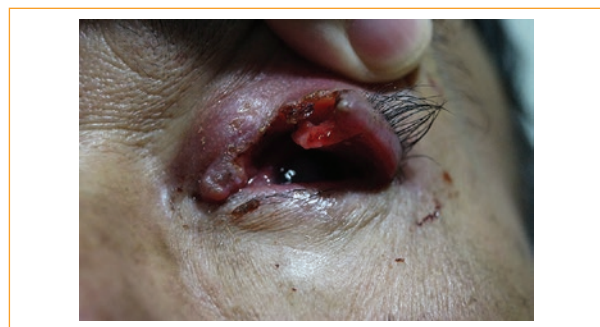
Figura 1. Vista de frente, se aprecia lesión ulcerada con bordes irregulares y pérdida de la arquitectura palpebral superior.

Paciente varón de 68 años de edad que presenta en la órbita izquierda una lesión ulcerada, con bordes irregulares y pérdida de la arquitectura del tercio medio a interno del párpado superior (Fig. 1), observándose madarosis en el área del borde libre palpebral de dicha lesión (Fig. 2), córnea con edema sectorial superior, con