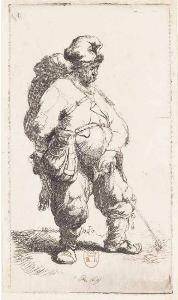
Hombre orinando Firmada y fechada RHL 1631 Aguafuerte. 83 x 49 mm