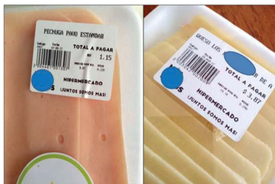
Figura 2. Etiquetado en productos reempacados en los establecimientos estudiados.