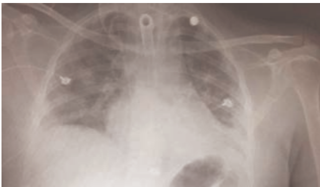
Figura 1: Radiografía portátil anteroposterior de tórax, en la cual se observan consolidaciones bilaterales e imagen en vidrio despulido.

Por esta razón, se inició reanimación hídrica y manejo farmacológico mediante azitromicina, hidroxycloquina, oseltamivir y metilprednisolona. Sin embargo, la paciente continuó con cifras de hipotensión, por lo que se decidió ini-