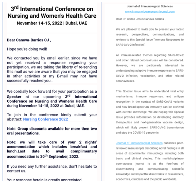
Figura 1. Ejemplos de invitación a Congresos (derecha) y Revistas predatoras (izquierda). Elaboración propia

Relativo a este tema, también se refiere a los Congresos predatoros, en los cuales se invita a investigadores a realizar sus ponencias o presentación de sus trabajos (figura 1), por el abono de una tarifa, generalmente elevada, sin procesos de verificación de la calidad de las ponencias o de la pertinencia de las temáticas. (36) En la figura 1 se muestra un ejemplo de congreso predatoro, el cual se halla ligado al “ Coalesce Research Group ” mencionado como tal en la Beall’s List ( https://beallist.net/#update ), una página que marca los potenciales congresos y revistas predatoras.