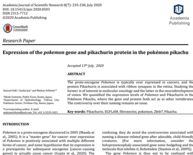
Figura 2. Artículo publicado por revista predatora

Otros ejemplos de artículos publicadores en revistas predatoras son los artículos titulados “Proteomic Analysis of Autotomy and Regeneration in the Slowpoke Tail” publicado en Enzyme Engineering, y el artículo que vinculaba la aparición de la epidemia por COVID-19 al consumo del Pokemon Zubat titulado “Cyllage City COVID-19 Outbreak Linked to Zubat Consumption” del 2020 y publicado en la predatora American Journal of Biomedical Science & Research, ambos del año 2020.