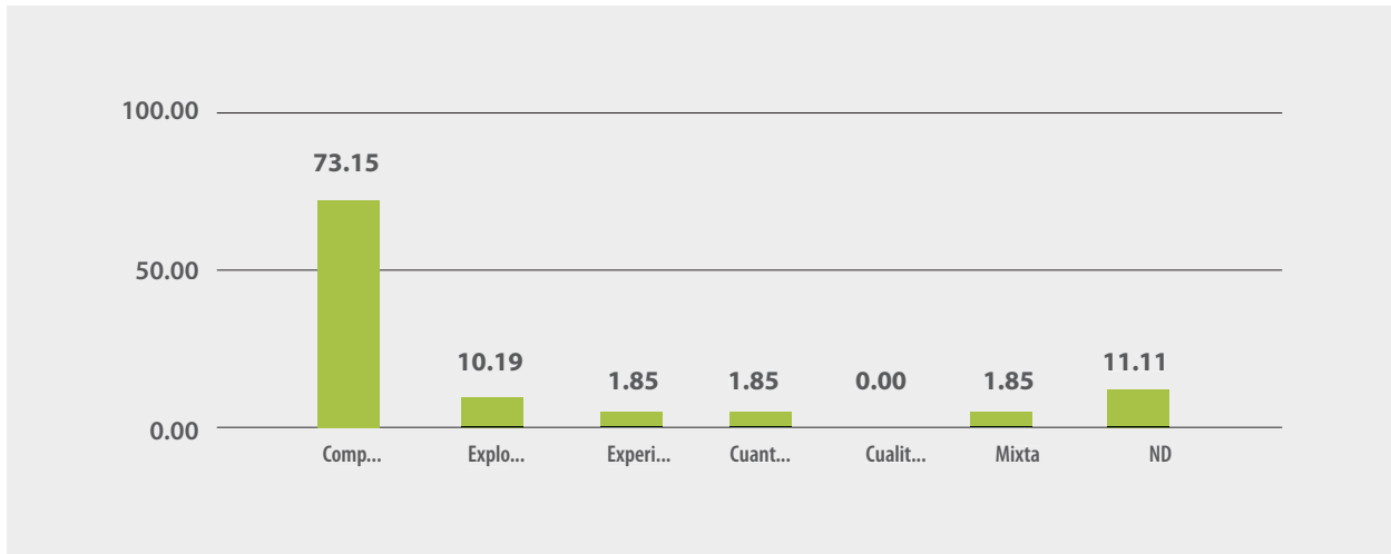
Figura 2. Según metodología