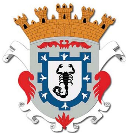
Figura 1. Escudo Civil y de Armas de Colotlán, Jalisco