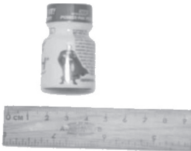
Figura 1. Fotografía de un frasco de poppers .

Las consecuencias del consumo de poppers incluyen aumento de la presión intracraneal, taquicardia, mareos, debilidad, palidez, dolores de cabeza, náusea, vómito, irritaciones alrededor de los labios, mejillas y nariz y dermatitis. 10,11,16,17 Entre los efectos más graves se encuentran el desarrollo de neumonía lipoidea. 18