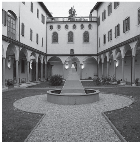
Convento della Calza is a location that is unique for its fascination, atmosphere, art and history, the ancient 14th-century Hospital dedicated to Saint John the Baptist, the Hotel Convento della Calza is today, one of the most charming destinations among Florence hotels. The Convent from who lived here beginning 1529 wore a strip of cloth on their left shoulder similar to a seccino (calza), which is the origin of the hospitality structure's name.