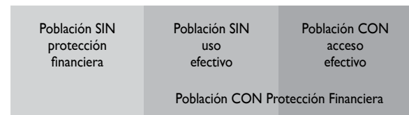
FIGURA 1. ESQUEMA DE DISTRIBUCIÓN DE LA POBLACIÓN EN RELACIÓN CON EL ACCESO EFECTIVO DE ACUERDO CON LA DEFINICIÓN PROPUESTA: ACCESO EFECTIVO ES EL REMANENTE DE DESCONTAR DE LA POBLACIÓN TOTAL A AQUELLOS SIN PROTECCIÓN FINANCIERA Y A AQUELLOS QUE, AL TENER PROTECCIÓN FINANCIERA, NO PUEDEN HACER UN USO EFECTIVO DE LOS SERVICIOS PREPAGADOS

Efectividad de los servicios, definida como la capacidad resolutive, significa solucionar el problema de