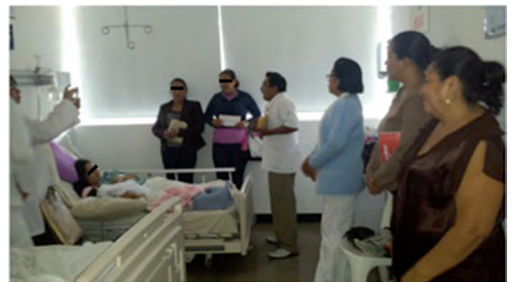
FIGURA 2. Personal de enfermería capacitando a la madre y familiares sobre los beneficios de la lactancia materna exclusiva en la Clínica Hospital de Chetumal.

La clínica hospital "B" de Chetumal es la única unidad médica del ISSSTE en Quintana Roo que tiene un programa de fomento a la lactancia materna exclusiva, con la política estricta de la no promoción ni consumo hospitalario de sustitutos de leche materna.