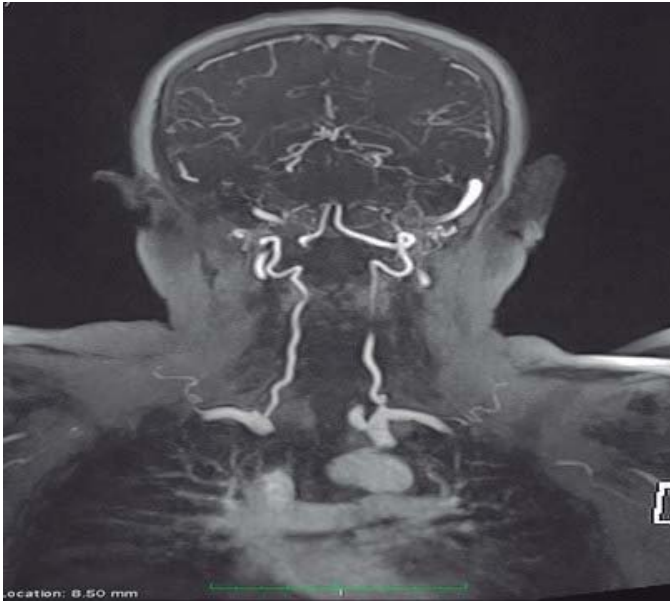
Figura 2. Imagen de angioresonancia en corte coronal. Se observa trombosis del seno sigmoideo derecho con ausencia del paso de material de contraste (flecha).