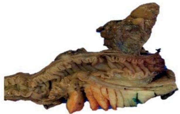
Figura 1. Especimen al corte que consta de neoplasia de cabeza de páncreas que engrosa la pared del intestino delgado, con presencia de áreas microquísticas de aspecto hemorrágico

El Departamento de Anatomía Patológica recibe espécimen para estudio transoperatorio, que consta de cabeza de páncreas y segmento de intestino con lesión neoplásica que mide 3x3cm de consistencia sólida con áreas microquísticas de color ámbar amarillentas con aspecto fibroso y hemorrágico (Figura 1). En los cortes congelados se encontraron células de citoplasma espumoso microvesicular de aspecto benigno con atipia leve; en los cortes definitivos teñidos con HyE se identifica adenocarcinoma ductal bien diferenciado con glándulas espumosas, invasor (Figura 2A), con áreas de neoplasia intraepitelial pancreática (Panin) (Figura 2B). Se realizaron tinciones de azul alciano y ácido peryódico de Schiff, así de inmunohistoquímica para la detección de CK7, CK19, CK20, MUC1, MUC2 y MUC5 AC. El tumor presentó fenotipo pancreobiliar CK7 + , CK19 + , MUC1 + , MUC5AC + , CK20 - y MUC2 - (Figura 3). Confirmando el diagnóstico de APGE.