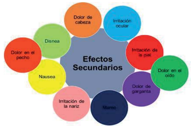
Figura 1. Efectos secundarios que presenta el personal de salud al estar en contacto con medicamentos citostáticos. Elaboración propia.

Los desechos citostáticos pueden crear serios problemas de seguridad y salud, por lo tanto, el mal manejo de estos puede provocar para el personal expuesto a ellos algunos padecimientos como infertilidad, cánceres, mutaciones, dermatitis, consecuencias durante el embarazo (abortos espontáneos, defectos del nacimiento, por mencionar algunos) 12 . Además, hay investigaciones que reportan algunos efectos secundarios entre los trabajadores de atención médica oncológica al preparar o administrar fármacos antineoplásicos (Figura 1) 13 .