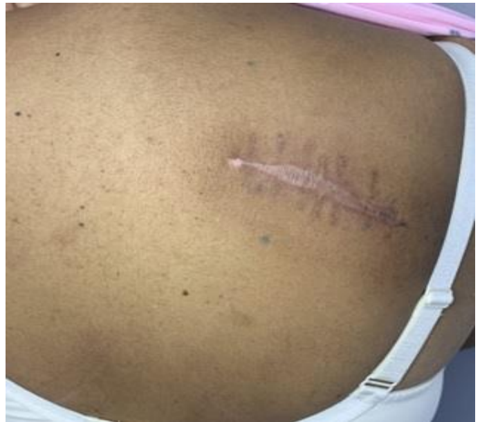
Figura 3. Imagen posterior a extirpación quirúrgica.