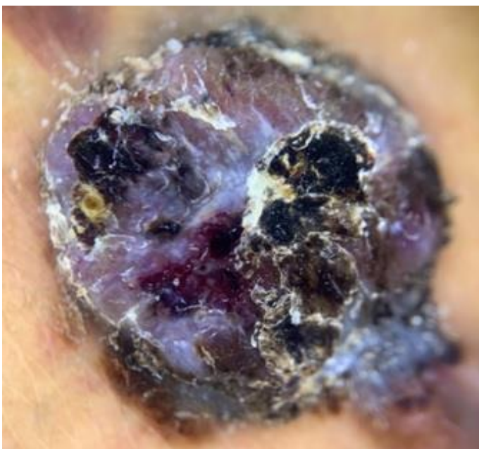
Figura 2. Melanoma nodular visto con dermatoscopia