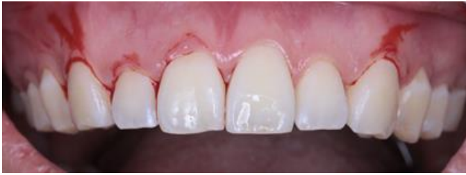
Figura 3. Incisiones intrasulculares y submarginales