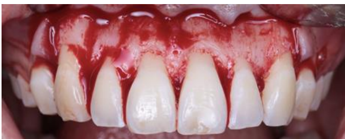
Figura 6. Recontorneo óseo por medio de osteoplastia