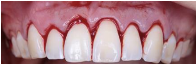
Figura 4. Collar de encía fue retirado con cureta