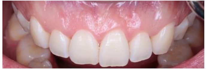
Figura 8. Fotografía final 7 días después