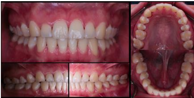
Figura 1. Fotografía posterior a la profilaxis.

A la exploración intraoral se observó buena higiene oral, oclusión adecuada siendo Clase I de angle molar y canina 13 , línea media concordante, adecuada cantidad de encía queratinizada, sin enfermedad periodontal; márgenes gingivales discrepantes en el sector anterosuperior (Fig. 1).