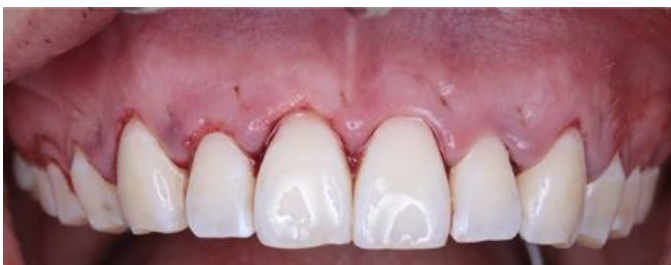
Figura 7. Sutura Nylon 5-0 en colchonero vertical interno