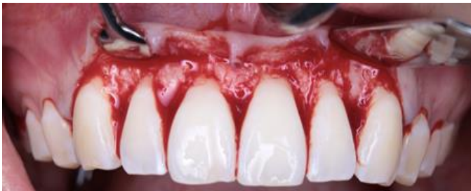
Figura 5. Elevación del colgajo de espesor total