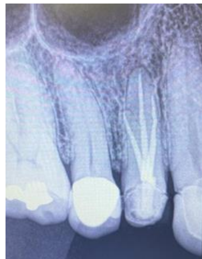
Figura 4. Radiografía 6 meses después de término de tratamiento