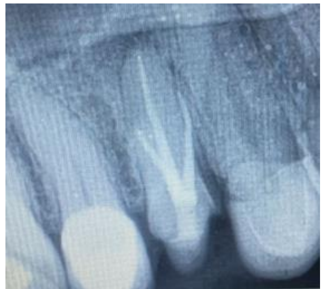
Figura 3. Radiografía final de tratamiento