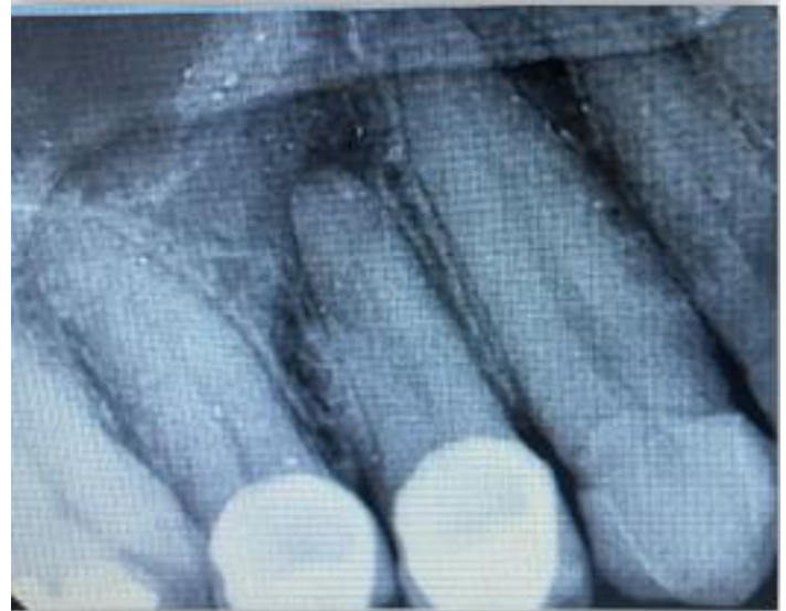
Figura 1. Radiografía inicial

taurado con corona de metal-porcelana. Radiográficamente, se observa anatomía radicular inusual con zona radiolúcida periapical (figura 1).