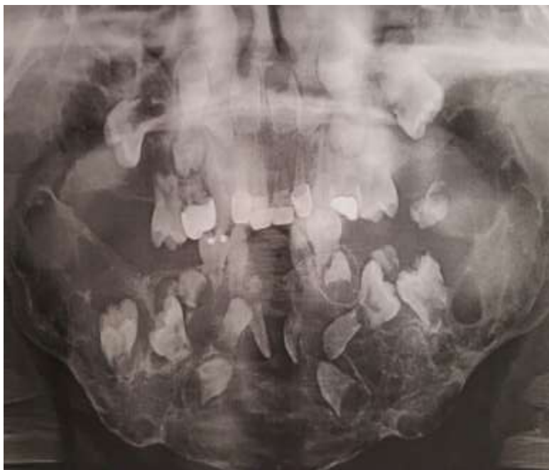
FIGURA 1. Hallazgos de radiografía panorámica del paciente