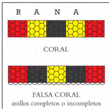
Figura 2. Diferencias entre coral real y falsa coral.