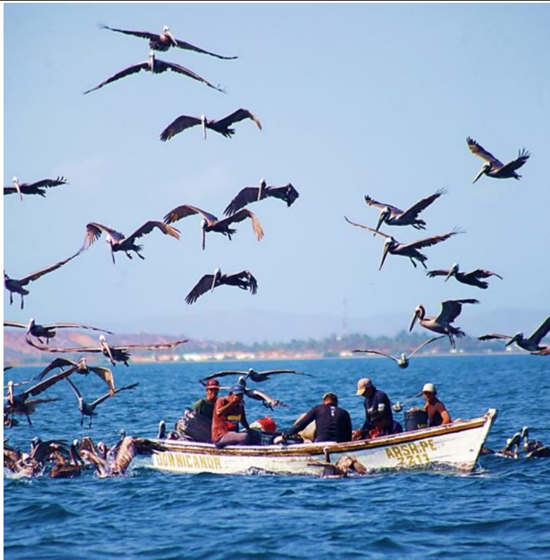
Figura 3. Pescadores artesanales en isla de Coche, Venezuela, rodeados de Pelecanus occidentalis que esperan que les regalen los peces sobrantes

Fuente: Foto cortesía de Jesús Hernández Castillo, tomada el 23 junio del 2022.