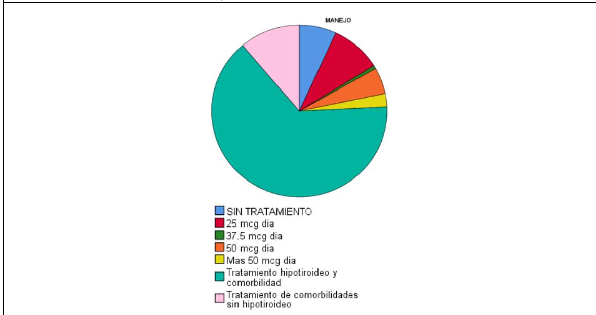
Gráfica 3. Enfermedad tiroidea y comorbilidades en la muestra

comorbilidad y 13 con tratamiento a comorbilidades sin manejo de hipotiroidismo. En el grupo 2, 6 sin tratamiento, 6 con 25 mcg día, 2 con 50 mcg día, 4 con más 50 mcg día, 59 con tratamiento hipotiroideo y alguna comorbilidad, 5 sin tratamiento a hipotiroidismo, pero si para comorbilidades. Con base en los valores, se tiene un RR de 1.97 en la muestra con afección de ambas patologías sobre la media poblacional.