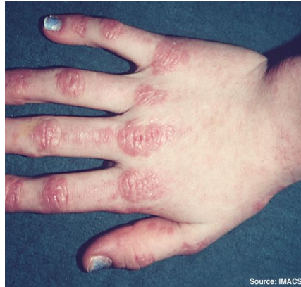
Figura 1. Fotografía de pápulas de Gottron

Nota. Pápulas eritematosas que recubren las articulaciones metacarpianas e interfalángicas en paciente con dermatomiositis juvenil (5).