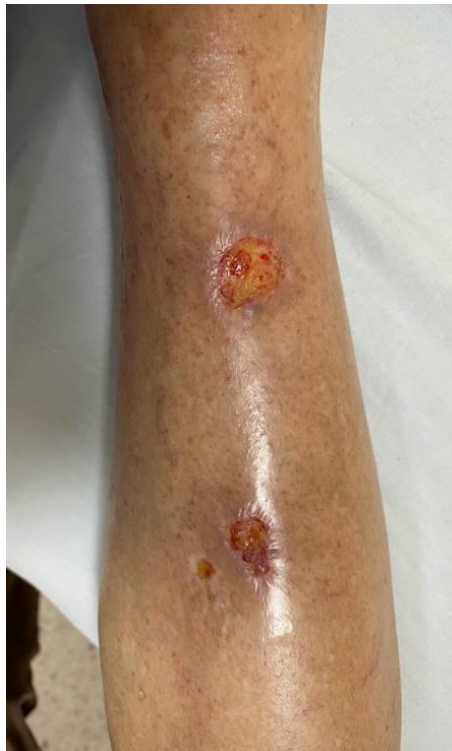
Figura 2. Úlcera clásica de leishmaniasis cutánea. Upala, Alajuela, Costa Rica