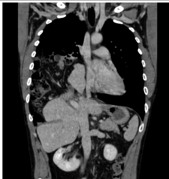
Figura 2. Signo de herniación de órgano en una tomografía de tórax

Fuente. Sala C, Bonaldi M, Mariani P, et al. Right post-traumatic diaphragmatic hernia with liver and intestinal dislocation. J Surg Case Rep [Internet] 2017; 2017(3).