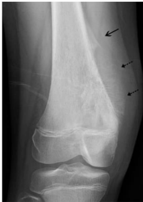
Figura 1. Radiografía de osteosarcoma de fémur derecho

Nota. Radiografía anteroposterior que muestra una masa con mineralización intraósea, la típica reacción perióstica en sol naciente (flechas pequeñas) y el triángulo de Codman (flecha grande).