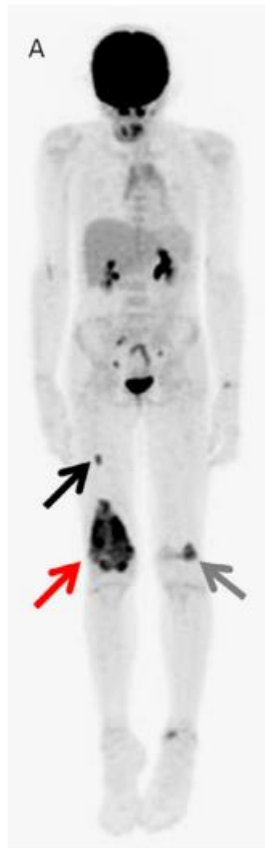
Figura 3. Tomografía de emisión de positrones de osteosarcoma de fémur derecho

Nota: Imagen obtenida de un PET Scan que muestra osteosarcoma en fémur derecho (flecha roja) y metástasis óseas (flechas negras).