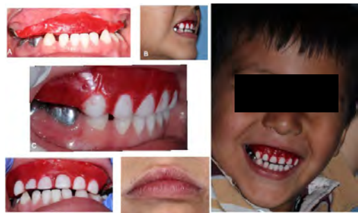
Figura 3. Prueba final y cementación del mantenedor de espacio. A) Prótesis terminada, B,C,D,E) Pruebas de la prótesis en boca. D) Después de la cementación.