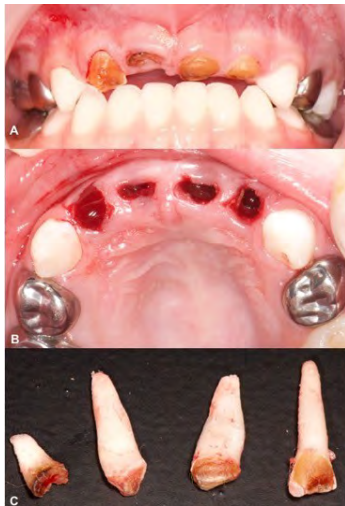
Figura 4. A) Fragmentos radiculares previa intervención quirúrgica. B) Defecto pos extracción. C) Dientes extraídos.

se brindó técnica de cepillado y se realizó profilaxis y topicación de fluoruro en gel al 2%, al mismo tiempo se realizó manejo del dolor y eliminación de focos de infección, para eso se llevó a cabo la pulpectomía del OD 85 con obturación de conductos con Vitapex®.