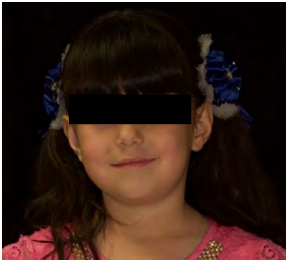
Figura 1. Paciente con sonrisa baja y aspecto introvertido

Existen reportes en la literatura que muestran que aquellos niños que sufren negligencia parental tienen 5,2 veces más de probabilidad para tener lesiones cariosas presentes y sin tratamiento. 10