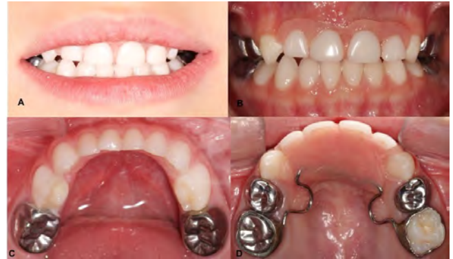
Figura 6. Fotografía final a los 2 meses de seguimiento