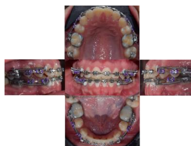
Figura 4. Fotografías intraorales