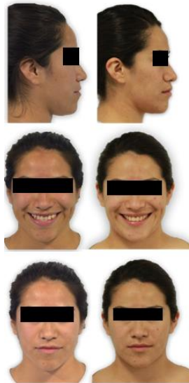
Figura 9. Fotografías extraorales antes y después del tratamiento.

en la posición definitiva y así elaborar un plan de tratamiento que no se vea modificado en el cambio de dentición. 5 Lo anteriormente mencionado se confirma en el presente caso, puesto que ya los incisivos superiores estaban en una posición de la cual no podrían haber más cambios en el transcurso de la edad, puesto que la paciente ya es adulta.