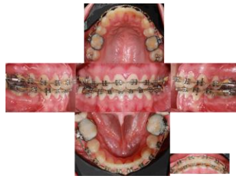
Figura 6. Fotografía intraorales