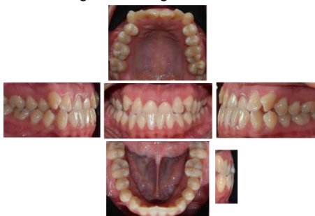
Figura 2. Fotografías intraorales