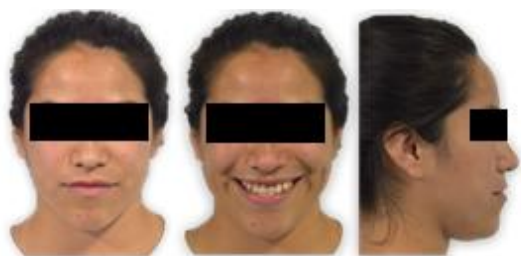
Figura 1. Fotografías extraorales