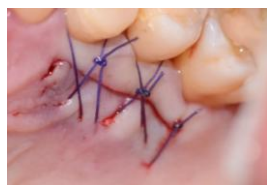
Figura 6. Sutura del paladar.