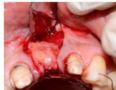
Figura 8. Estabilización del injerto en el lecho receptor.