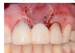
Figura 9. Posicionamiento del provisional libre de presión sobre el injerto.