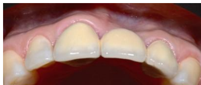
Figura 1. Vista oclusal del defecto clase III de Seibert.