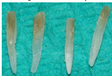
Figura 5. Postes biológicos confeccionados con disco de diamante, obtenidos de los órganos dentarios 5.1 y 6.1.