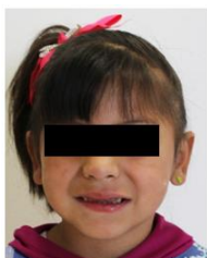
Figura 1. Fotografía extraoral.