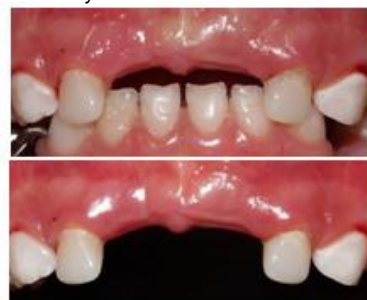
Figura 7. Restauración final de órganos dentarios 5.2 y 6.2 con postes biológicos y fundas de celuloide.