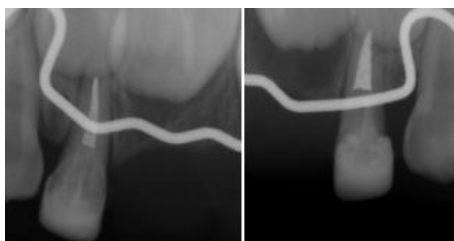
Figura 9. Radiografía digital final de órganos dentarios 5.2 y 6.2 con poste biológico cementado y funda de celuloide.