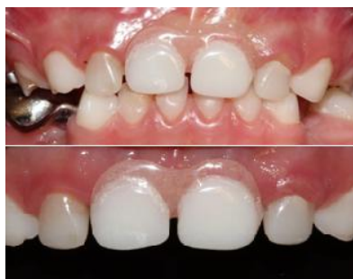
Figura 8. Restauración final de órganos dentarios 5.2 y 6.2 con postes biológicos y fundas de celuloide y reposición de piezas 5.1 y 6.1 con pedodontic.