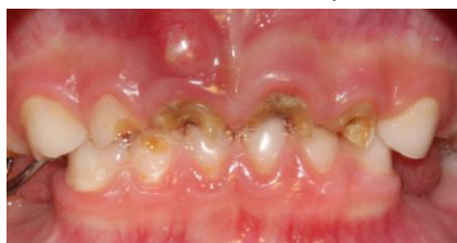
Figura 2. Fotografía intraoral frontal, se expone la destrucción coronaria de órganos dentarios 5.2, 5.1, 6.1, y 6.2.