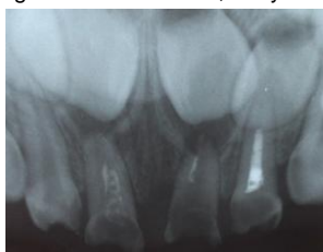
Figura 3. Radiografía inicial. Se observan pulpectomías previas en órganos dentarios 5.1, 6.1 y 6.2.